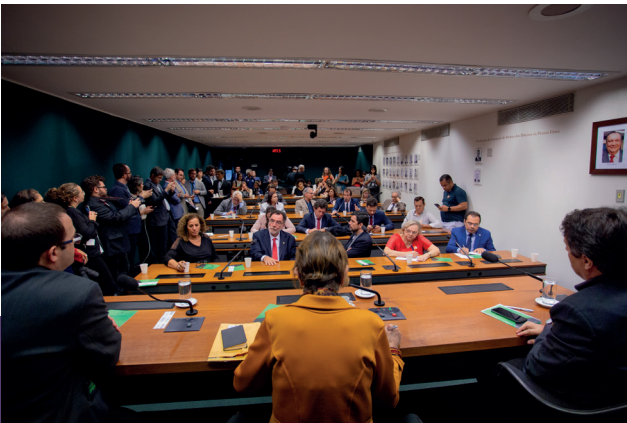
Ato de lançamento do Observatório do Conhecimento, em plenário da Câmara dos Deputados, em Brasília, abril de 2019

A rede que reúne entidades do movimento docente de universidades públicas de todo o país, surgiu a partir da preocupação com o aumento da retórica de ataques à ciência, à produção do conhecimento e os sucessivos cortes orçamentários. Para denunciar as tentativas de perseguição à liberdade acadêmica. Para dialogar de perto com os tomadores de decisão, em especial no Congresso Nacional.