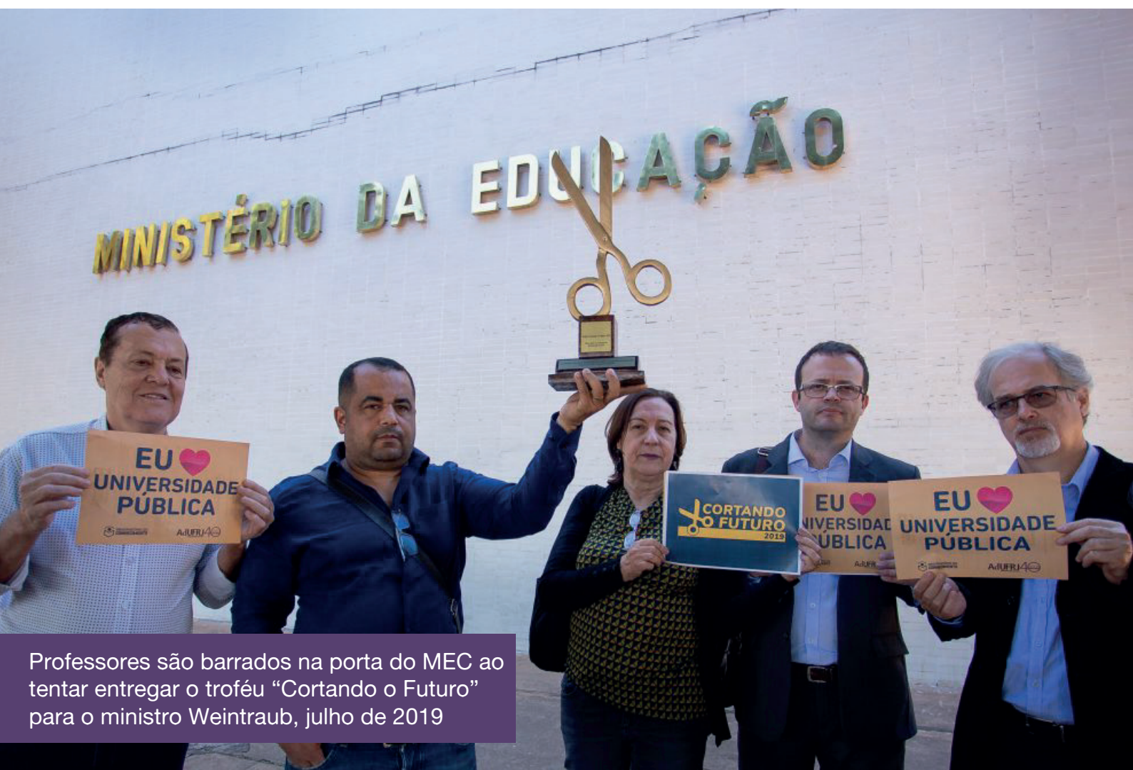
Professores são barrados na porta do MEC ao tentar entregar o troféu “Cortando o Futuro” para o ministro Weintraub, julho de 2019

O Observatório promove novas formas de luta para dialogar e mobilizar a sociedade. Presença organizada nas redes sociais, como nos tuitos, ou as projeções nos muros de cidades de todo o país amplificam o alcance das nossas pautas