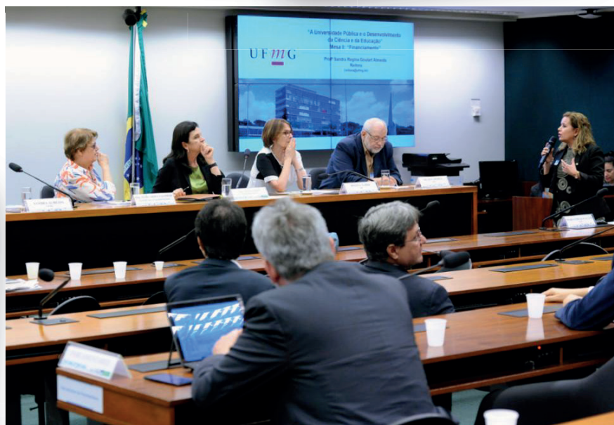
Seminário em parceria com Comissões de Educação e C&T da Câmara dos Deputados discutiu desenvolvimento, outubro de 2019