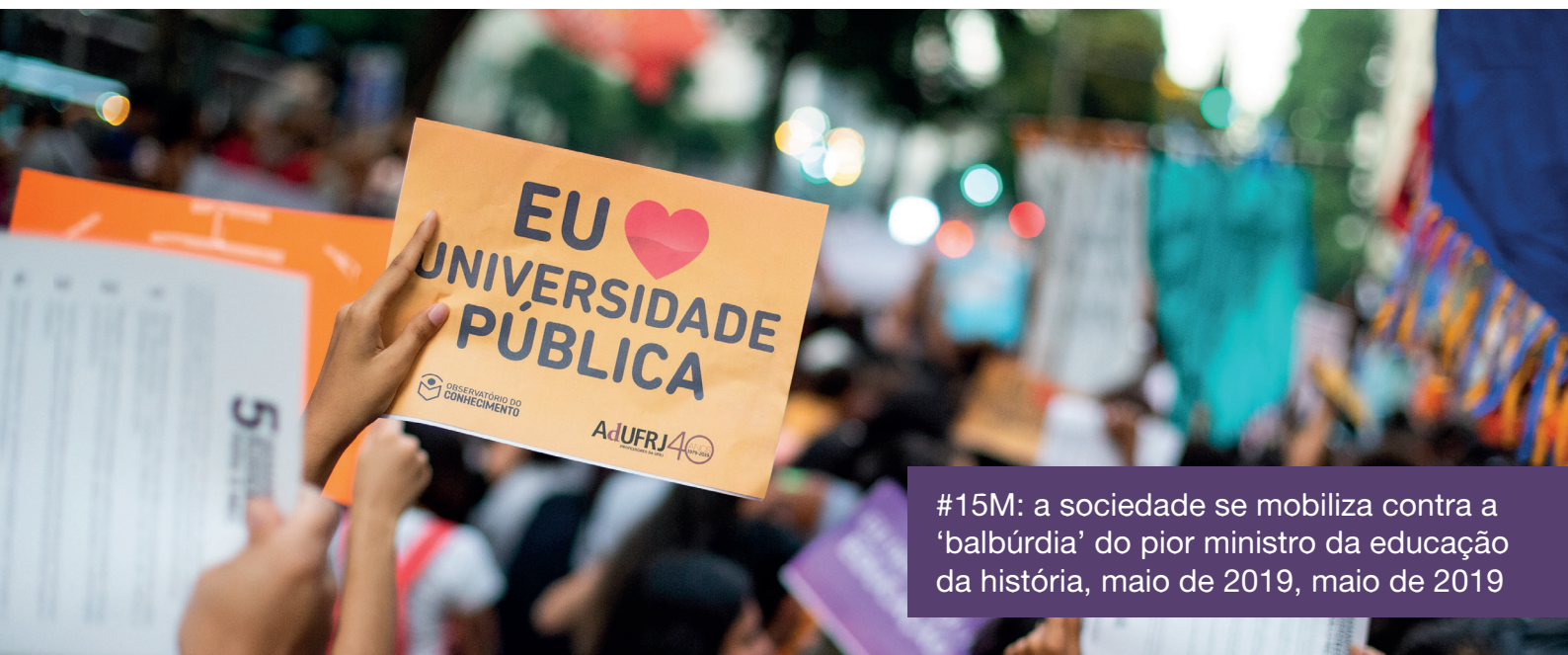
#15M: a sociedade se mobiliza contra a ‘balbúrdia’ do pior ministro da educação da história, maio de 2019, maio de 2019

Para defender avanços como as cotas sociais e raciais, combater a desinformação sobre a carreira docente universitária ou para demonstrar com fatos e números a centralidade da pesquisa, ciência e tecnologia no desenvolvimento do país, o Observatório produziu publicações com argumentos qualificados que auxiliam no diálogo com a sociedade e na sensibilização de nossas pautas no parlamento.